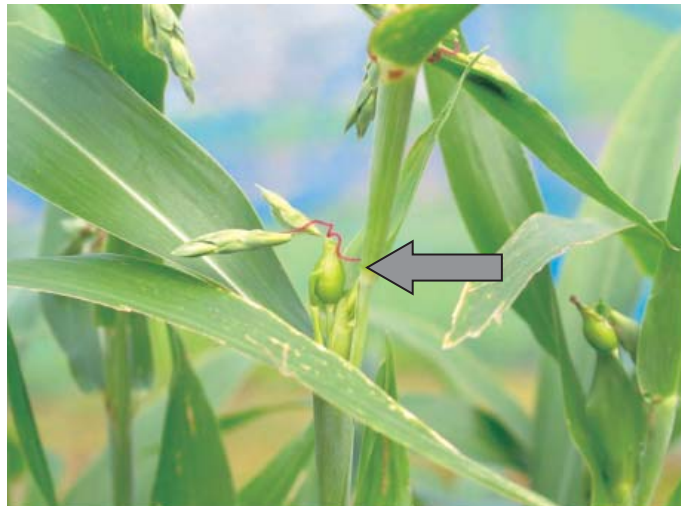
写真2 「あきしずく」の柱頭 (矢印)