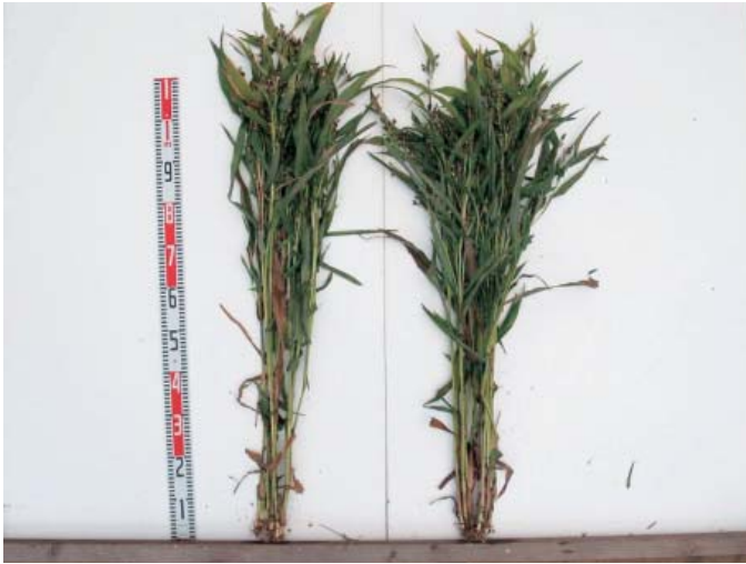
写真1 「あきしずく」の草姿 (右：あきしずく、左：はとひかり)