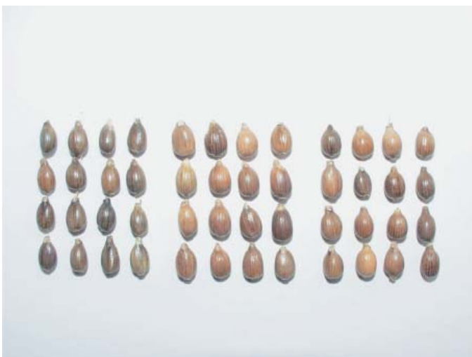
写真3 「あきしずく」の穀実 (左：あきしずく、中：はとひかり、右：岡山在来)