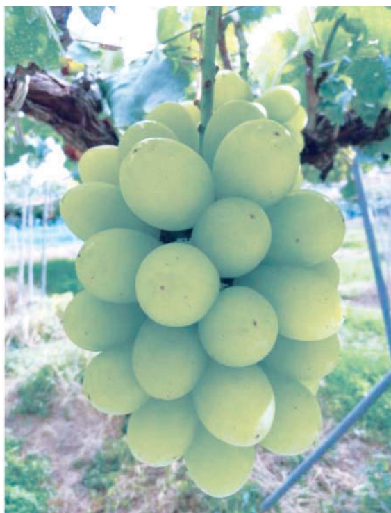
Fig.3 A seedless cluster of 'Sun Verde' .