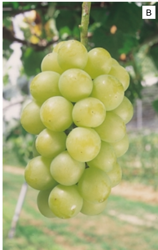
Fig. 2. Fruiting shoots (A) and fruit cluster (B) of 'Honey Venus' grape.