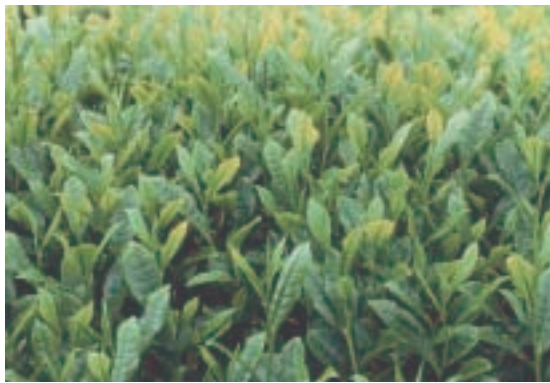
図-2 ‘そうふう’一番茶新芽