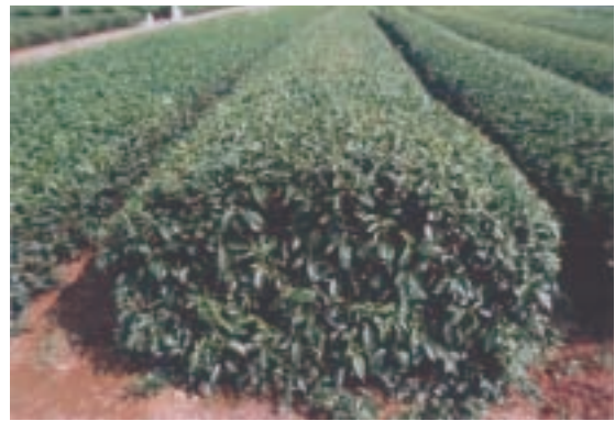
図-3 ‘そうふう’成園の生育状況