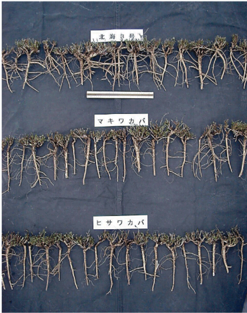
写真2 アルファルファの根の形態 2002年11月25日 北海道農業研究センター