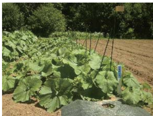
第2図 カボチャの草姿

左：「ジェジェJ」、右上：「えびす」、右下：「雪化粧」。2015年7月9日撮影。北海道農業研究センター（札幌）