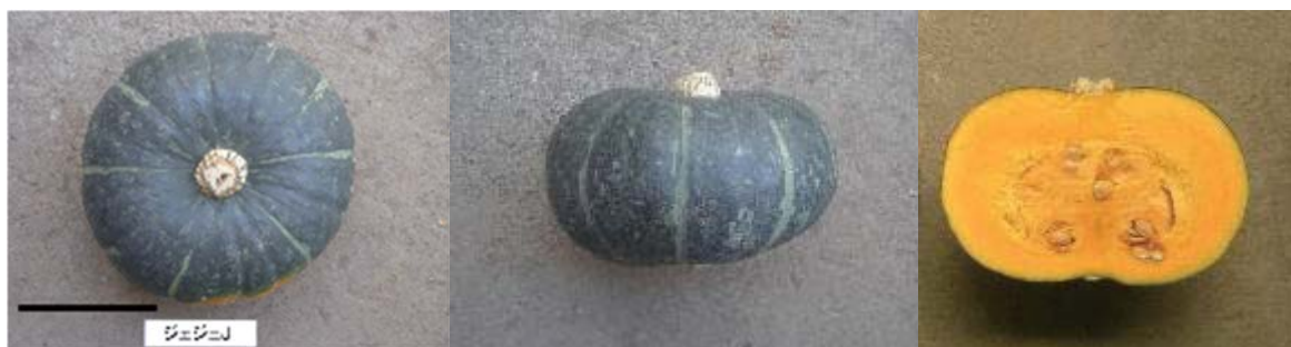
第3図 「ジェジェ J」の果実外観と果実断面

黒色バーは10cm. 2012年9月18日撮影. 北海道農業研究センター(札幌).