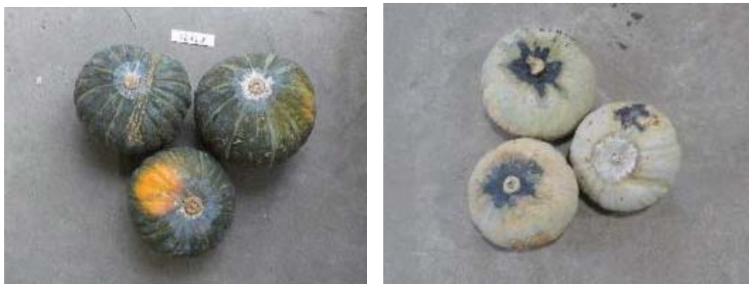
第5図 貯蔵後のカボチャの腐敗

1) 2012年11月14日調査、2013年11月13日調査、2014年11月6日調査、2015年11月1日調査。 2) 2012年12月14日調査、2013年12月12日調査、2014年12月2日調査、2015年12月1日調査。 3) 2014年、2015年平均。