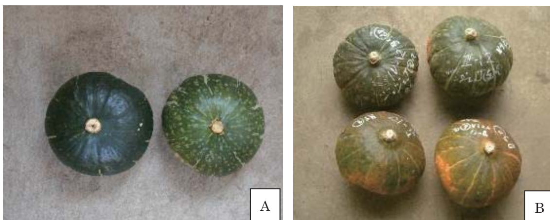
第4図 貯蔵後のカボチャ果皮の褪色