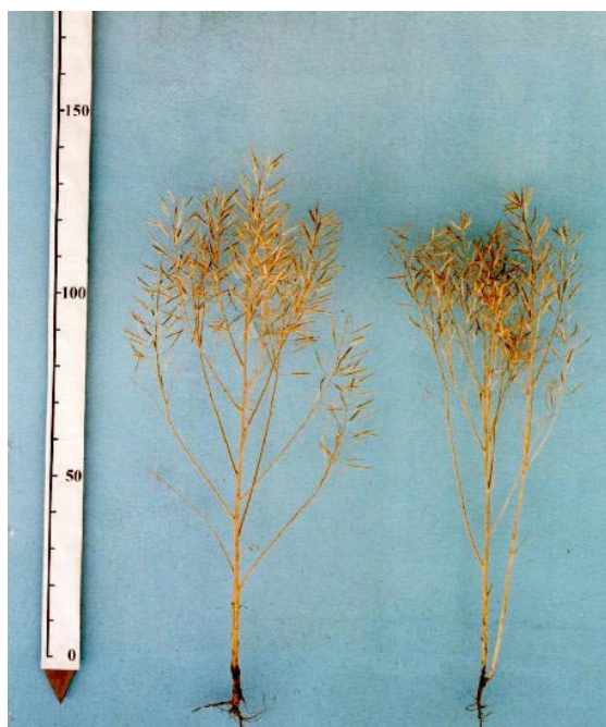
キラリボシ アサカノなたね 写真1 草姿（育成地）

環境負荷低減のため、農業関連分野においても農業由来有機物資源の地域内循環利用が求められており、環境や食の安全・安心等への関心の高まりから、今後各地で本格的な取り組みが期待されている（合田 2004）。畜産経営とうまく連携できれば、なたね粕を飼料用としてカスケード利用することができ、なたねを資源とした小地域で完結する循環システムを構築することも可能であろう。今後、耕畜連携の分野にも視野を広げ、資源循環型社会構築のための一材料として、「キラリボシ」が利用されることを祈念する。