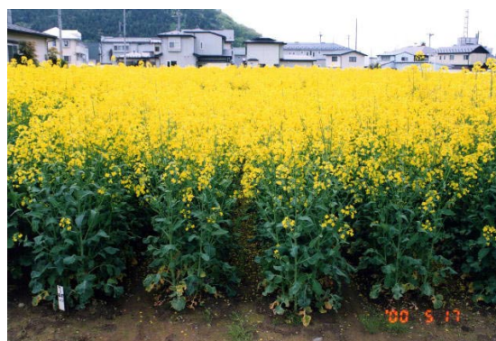
写真3 開花盛期の「キラリボシ」（育成地）