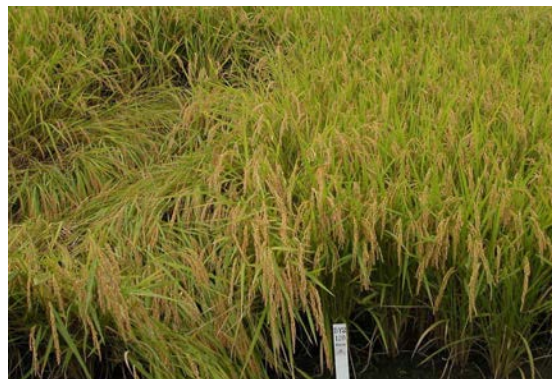
写真2 直播栽培(表面散播400粒/m 2 )における草姿(左:「あきたこまち」、右:「萌えみのり」)