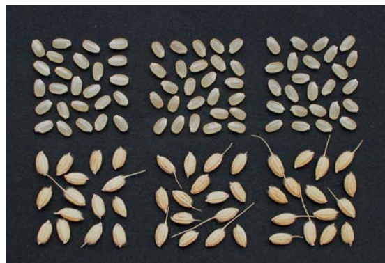
写真3 籾及び玄米(左から「萌えみのり」、「ひとめぼれ」、「はえぬき」)